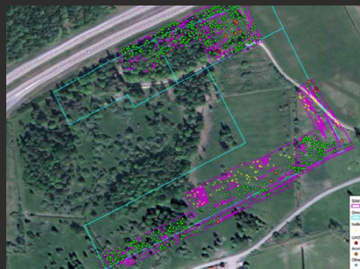
Utvalda indikationer möjliga omfattande OXA presenterade på kartunderlag. Rosa markeringar visar platsen för planerad byggnation.

Mot bakgrund av resultaten från utförd ytsökning kontrolleras varje möjlig OXA-indikation genom manuell eller maskinell uppgrävning/röjning. Påvisad OXA hanteras av EOD-utbildad personal och förvaras i av MSB godkända förvaringscontainers. Detta arbetssätt försäkrar hög framdriftstakt och minimerar stillestånd. Ammunitionen destrueras sedan och rapport överlämnas, vilken intygar att området röjts i enlighet med internationell standard IMAS och att marken kan användas utan restriktioner.