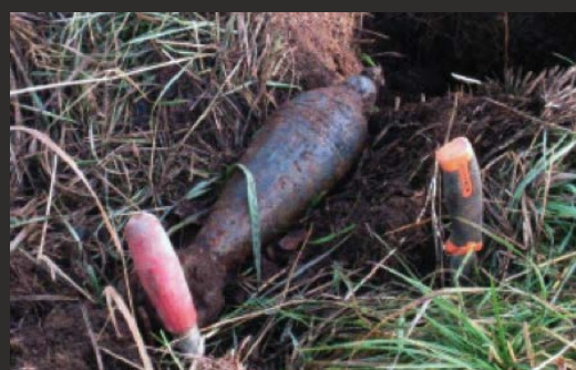
Markerad och inmätt påvisad OXA.