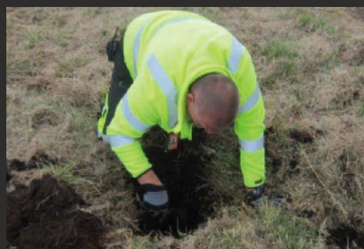
Manuell röjning av påvisad möjlig OXA-indikation