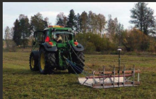
Maskinell dataloggning (4 GPS sonder). Lämpar sig på plana ytor mindre än 10 hektar.